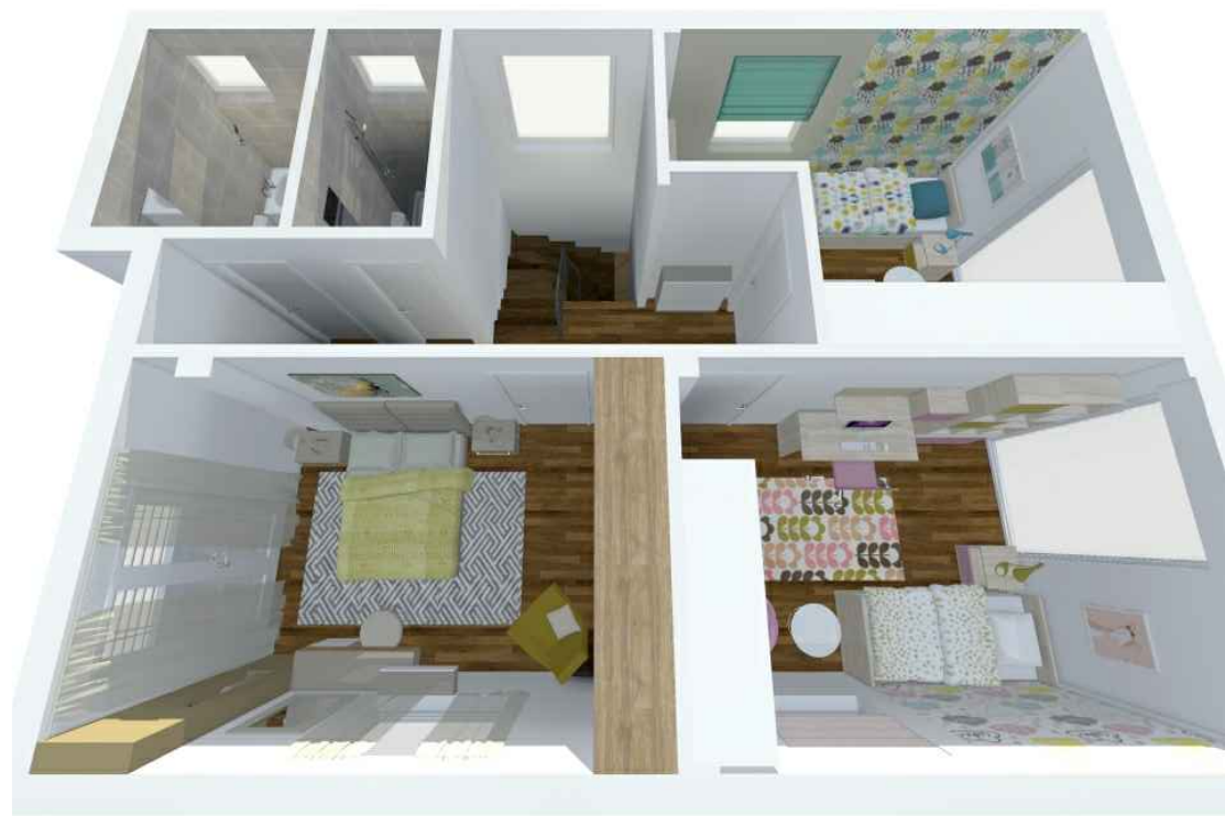
ОСНОВА НА КАТ