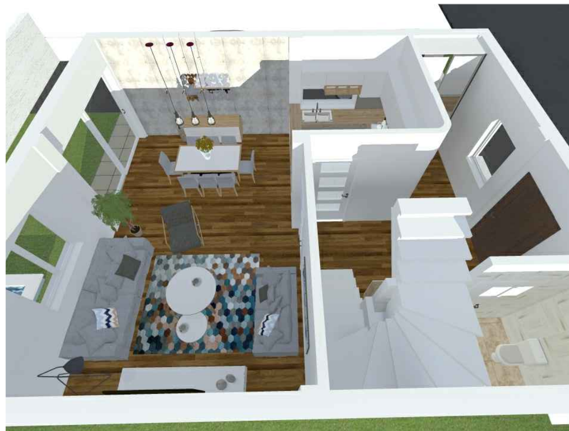
ОСНОВА НА ПРИЗЕМЈЕ